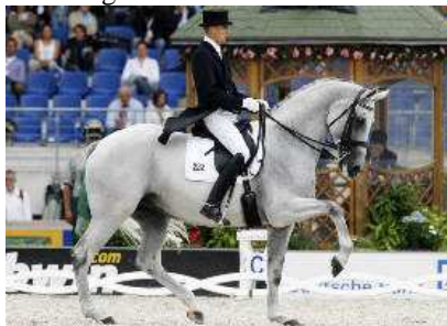
Blue Hors Matiné v. Silvermoon