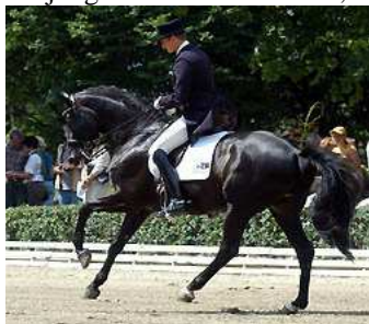
Monteverdi v. Partout

Symont wurde auf der Frühjahrskörung gekört. Dieser noble Schwarzbraune hat nicht nur drei sehr gute Grundgangarten sondern auch ein erstklassiges Interieur. Unter dem Reiter bietet er sich sehr gut an – ist vertrauensvoll, unkompliziert, taksicher und schwungvoll. In der HLP (70 Tage Test) belegte er als einer der jüngsten im Feld mit 122,54 Punkten Rang 5 in der Rittigkeit.