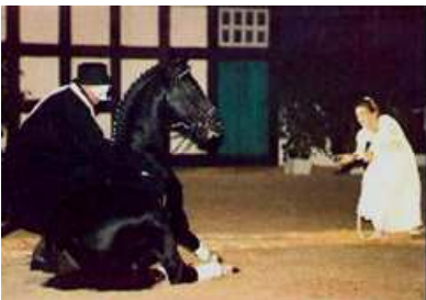
Kostolany im Phantom der Oper

Großmutter „Karben“, brachte die gekörnten Hengste „Karon“ (Prämienhengst, Sieger Dressur Kl. S, Vater des Hauptvererbers „Caprimond“) und „Karim“ (Brasilien) sowie die M/S-Dressurpferde „Karuso“ und „Kronos“. Ihre Töchter: „Kassandra“ v. Mozart brachte die oldenburgische Bundeschampionin und Grand Prix erfolgreiche Wildrose“ (ex Weltspitze), die für DM 590.000,- an einen englischen Dressurstall verkauft wurde; „Kassuben“ v. Enrico Caruso ist Mutter des gekörnten „Kapriolan F“ v. Exclusiv (Eliteauktion Medingen: DM 300.000,-/Dressurerfolge bis Grand Prix) sowie die Prämienstute „Kasita“ v. Maestro (Auktion Neumünster: DM 54.000,-), Kapstadt v. Falke ist Mutter des Siegerhengstes „Kostolany“ und Großmutter des Siegerhengstes „Kastellano“ (Vater des mehrfachen Bundeschampions „Keep Cool“).